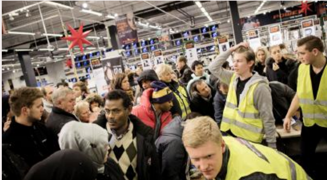
Man bør ha gode rutiner for gjennomgåelse og sjekk av kampanjer og andre markedsføringstiltak før de lanseres. Her fra Black Friday på Sørlandssenteret utenfor Kristiansand.

Forbrukertilsynet får vedtakskompetanse med én gang, mens Markedsrådet blir et klageorgan for vedtak truffet av Forbrukertilsynet. Markedsrådets behandling blir også endret fra muntlig til ren skriftlig behandling.