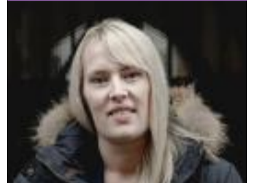
Alder: 32 Stilling: Samfunnsøkonom, analytiker Ny analyse as

~ Du, akkurat nå for tiden er det blitt en del fagbøker, siden jeg tar noen fag på London School of Economics. Det er en del klassikere om globalisering, som for eksempel Thomas Friedmans «The World is Flat». Den er jo ikke helt ny lenger, den er vel fra 2005.